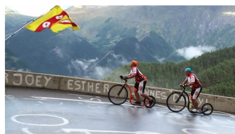
Het team bij elkaar – wat een kanjers!